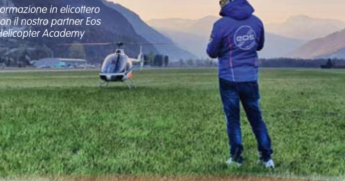
Formazione in elicottero con il nostro partner Eos Helicopter Academy