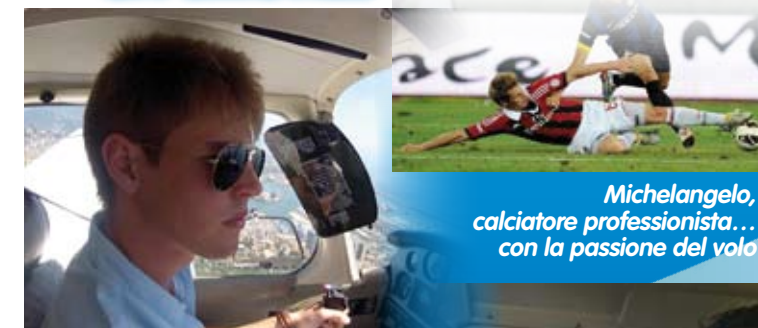
Michelangelo, calciatore professionista... con la passione del volo