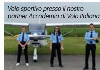
Volo sportivo presso il nostro partner Accademia di Volo Italiana

Grazie alla consapevolezza acquisita negli anni dai nostri docenti, particolare attenzione viene riservata agli studenti che presentano Disturbi Specifici dell'Apprendimento o Bisogni Educativi Speciali: essi sono seguiti da un apposi-