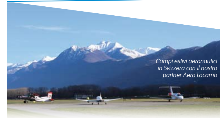
Campi estivi aeronautici in Svizzera con il nostro partner Aero Locarno

Dal terzo anno gli allievi hanno la possibilità di conseguire la Licenza di Pilota Privato di Aereo PPL-A tramite corsi ad hoc promossi dall'Istituto e svolti in sinergia con la scuola di volo Aero Locarno.